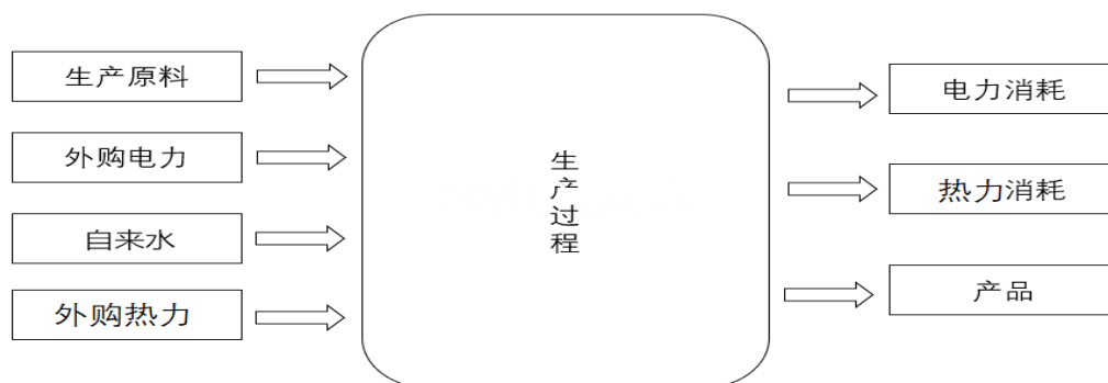
图 1 过程图